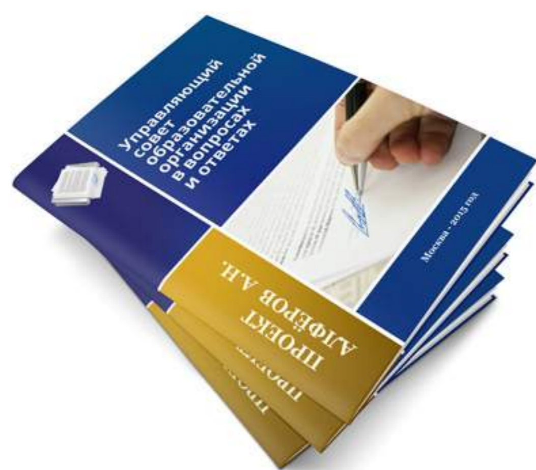
Сайт Управляющего совета образовательной организации