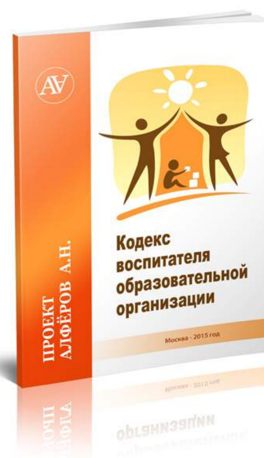
Кодекс воспитателя образовательной организации