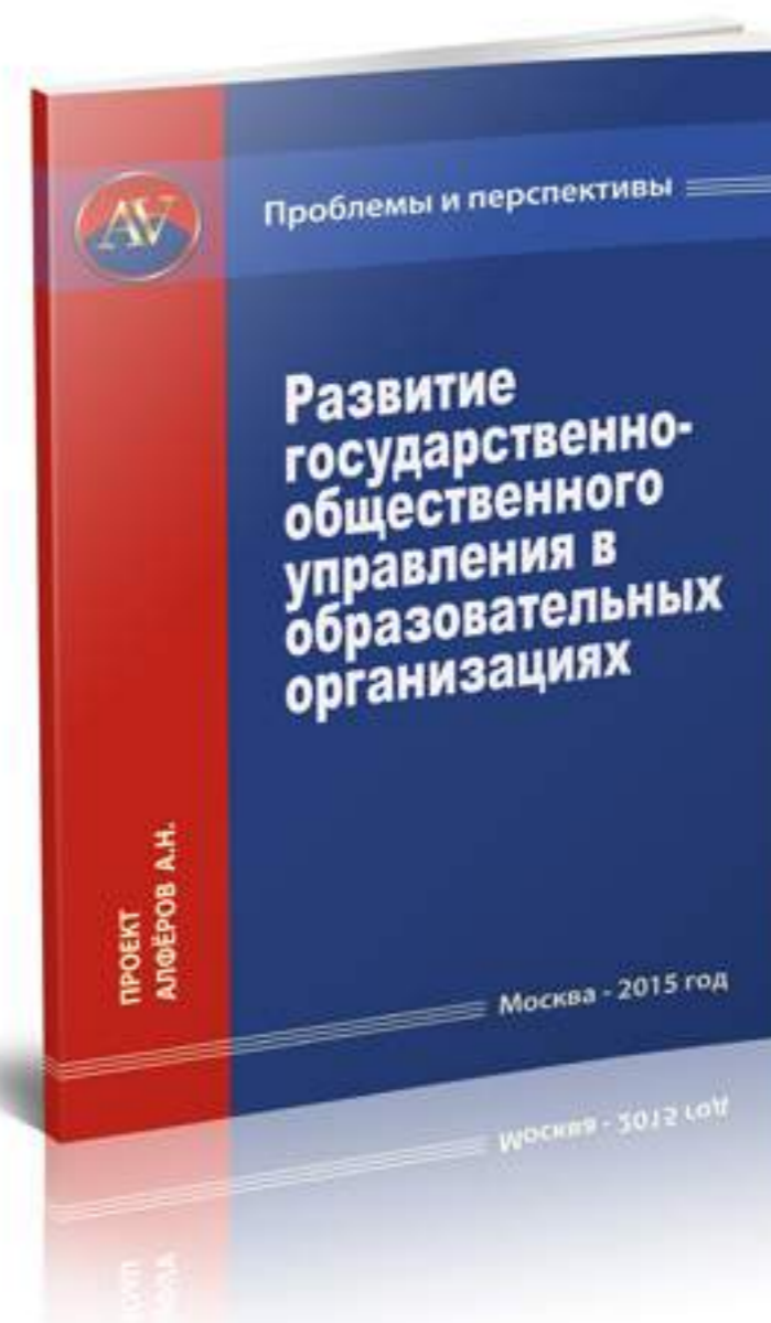
Развитие государственно-общественного Управления в образовательных организациях