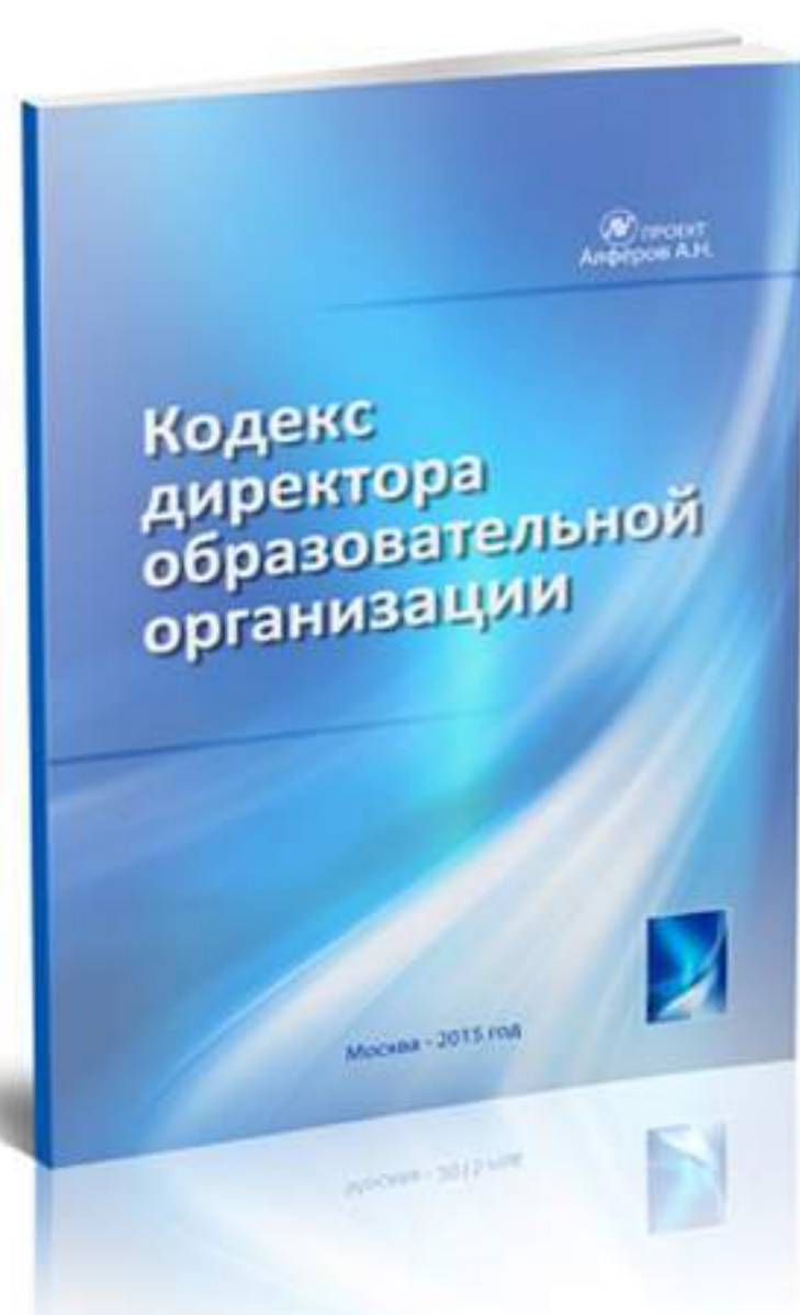
Кодекс Директора образовательной организации