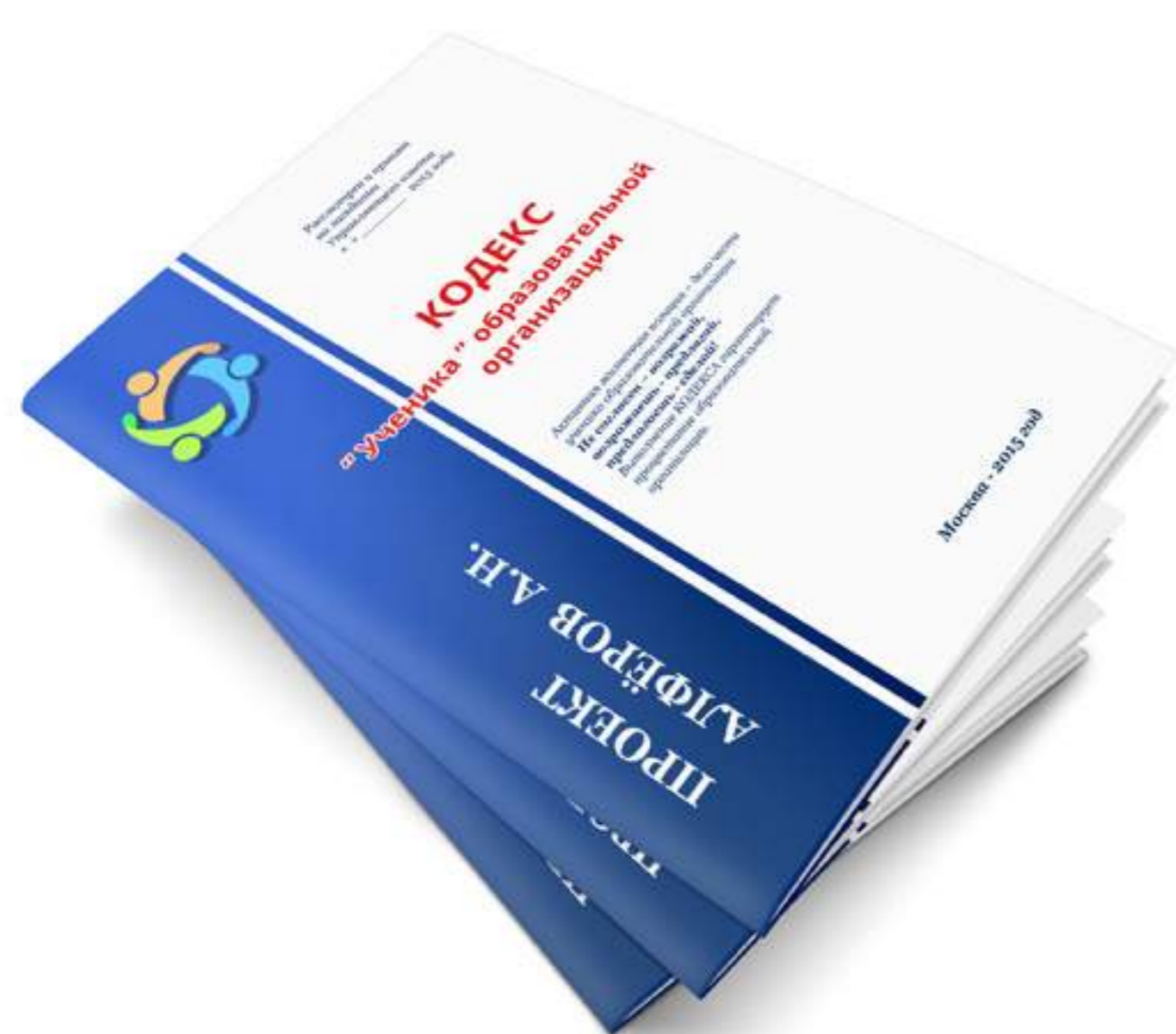
Кодекс Ученика образовательной организации