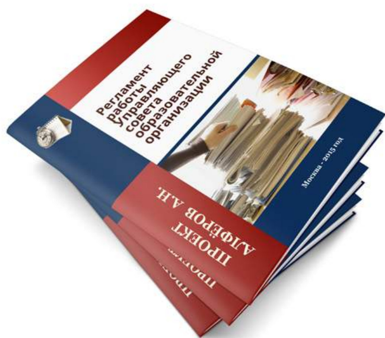
Регламент работы Управляющего совета образовательной организации